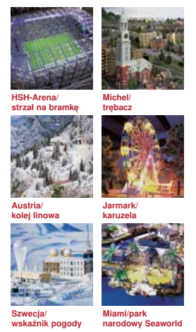
HSH-Arena/ strzał na bramkę