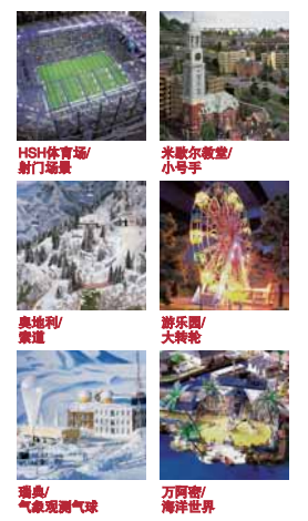
HSH体育场/射门场景 | 米歇尔教堂/小号手 奥地利/索道 | 游乐园/大转轮 瑞士/气象观测气球 | 万阿密/海洋世界